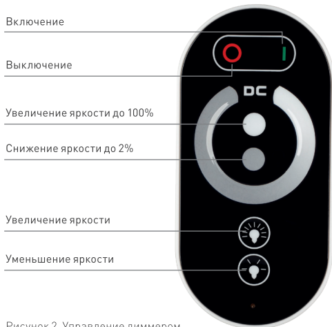
Рисунок 2. Управление диммером.

Примечание. При привязке нового пульта, удаляется предыдущий. Поддерживает управление только 1 пультом.