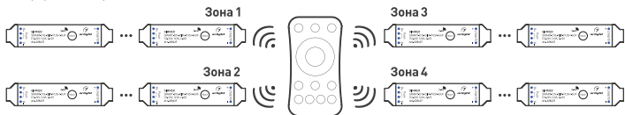
Рис. 3. Вариант построения системы с 4-зонным пультом дистанционного управления